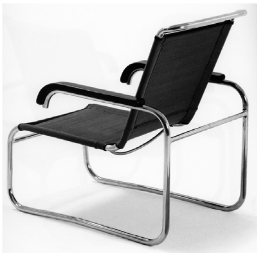
Afbeelding 10 Marcel Breuer (na 1931).