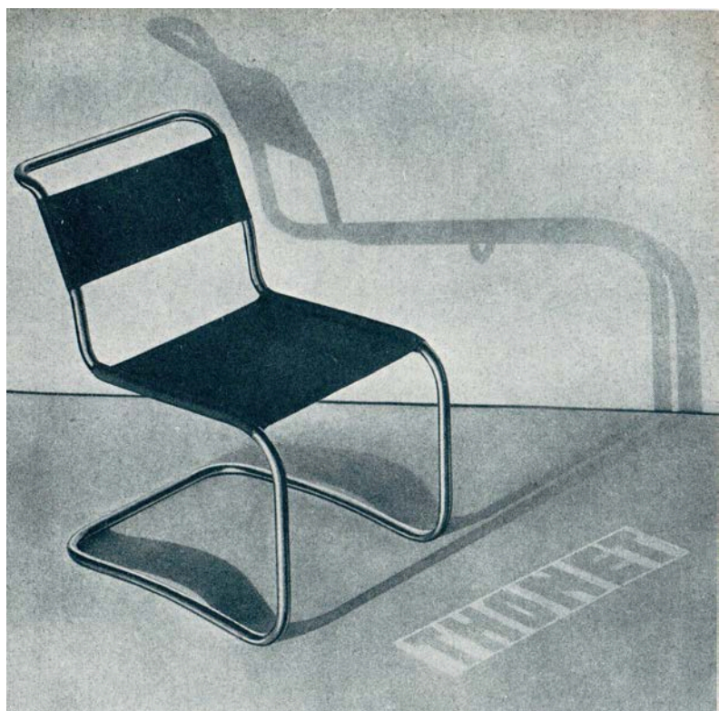
Afbeelding 1 Marcel Breuer B33 (tot 1932).

De wisselende toeschrijving van de stoelen in de vooroorlogse Thonet-catalogi levert tot en met vandaag verwarring, zelfs in museumkringen. Dat is ook niet verbazingwekkend, daar deze geschiedenis nogal gecompliceerd is. Hier moet ik echter vol-