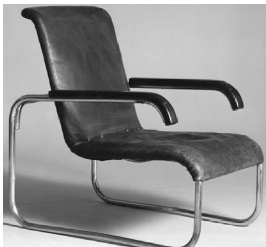
Afbeelding 11 Marcel Breuer (na 1931).

toonstelling in Parijs in 1930 werd getoond, is in de catalogi van 1930 tot en met 1935 steeds in de eerste versie van 1930 afgebeeld, terwijl de noodzakelijke dwarsverbinding aan de achterzijde drie keer werd veranderd. Het is een detail en het komt niet vaak voor, maar honderd procent zekerheid is er bij een identificatie niet (afbeelding 8-11).