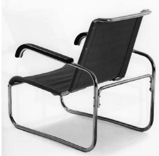
Afbeelding 9 Marcel Breuer (1931).