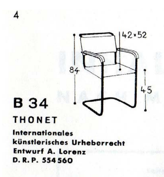
Afbeelding 4 Marcel Breuer B34 (na 1932).