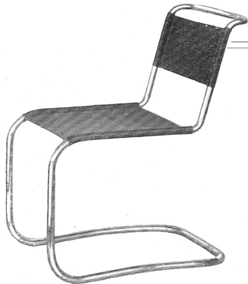
Afbeelding 7 Desta St12 (1929).