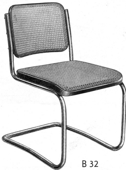
Afbeelding 6 Marcel Breuer (1928).

het volgende stellen: bij de ontwerpen van Breuer is het zeker dat wat wordt toegeschreven aan Breuer in de Thonet-catalogi tot en met 1932 ook klopt, ongeacht de 'hoeveelheid' inspiratie die hij bij Stam opdeed. Omgekeerd is het niet zo zeker. Mart Stam heeft na de stoelen voor zijn modelwoning in Stuttgart nauwelijks iets ontworpen wat ook uitgevoerd werd. 5 Het was de zakenman Lorenz die ervoor zorgde dat op de tekentafel van Desta de variaties op Stams oorspronkelijke ontwerp werden bedacht, die je in de handel kon brengen. Wel onder naam van Stam. Het model St 12 benaderde het meest het oorspronkelijke ontwerp van Stam (afbeelding 7). Om dezelfde redenen werden ook patenten bedacht en aangevraagd op naam van Stam, simpelweg om de concurrentie op afstand te houden. Conclusie: je moet iets weten van de achtergrondgeschiedenis van het ontwerp en de productie van een stoel om de toeschrijving in zo'n catalogus op waarde te kunnen schatten.