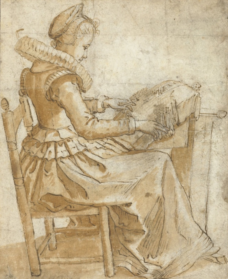
Figuur 4 Kantwerkster op een knopstoel, 1600-1625. Collectie Rijksmuseum, inv.nr.: RP-T-1886-A-597.

een rondlopende spaanhouten beugel (figuur 3 linksboven). 18 In de collectie van het Rijksmuseum Twenthe is een mogelijk zeventiende-eeuws exemplaar bewaard gebleven. 19 De eerste vierpotige stoel tussen de hier behandelde gematte stoelen die in de Gouden Eeuw naast elkaar voorkomen heeft even hoge poten met een rondlopende spaanhouten rugleuning (figuur 3 rechtsboven). 20 Dit model kent ook een variant met een beugel, gecombineerd met een hoge rug als van een gewone knopstoel (figuur 3 linksonder). 21