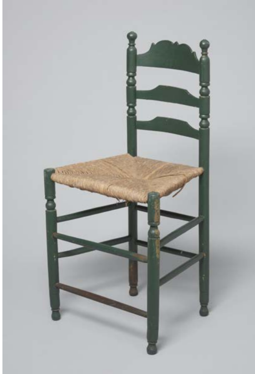
Figuur 7 Gegroende zeventiende-eeuwse knopstoel (1650-1700). Iepenhout. Collectie Nederlands Openluchtmuseum, inv. nr.: NOM.9230.OV.

Het deed hen te veel aan armoede denken. Bij het inrichten van hun woningen keken ze naar de traditionele rijk gedecoreerde interieurs van de maatschappelijke lagen boven hen en naar de roemrijke Gouden Eeuw. Als ze al een knopstoel in hun interieur plaatsten dan moest er meer sierdraaiwerk en snijwerk aan zitten, compleet met de zeventiende-eeuwse pinakelvormige knoppen (figuur 6). 42