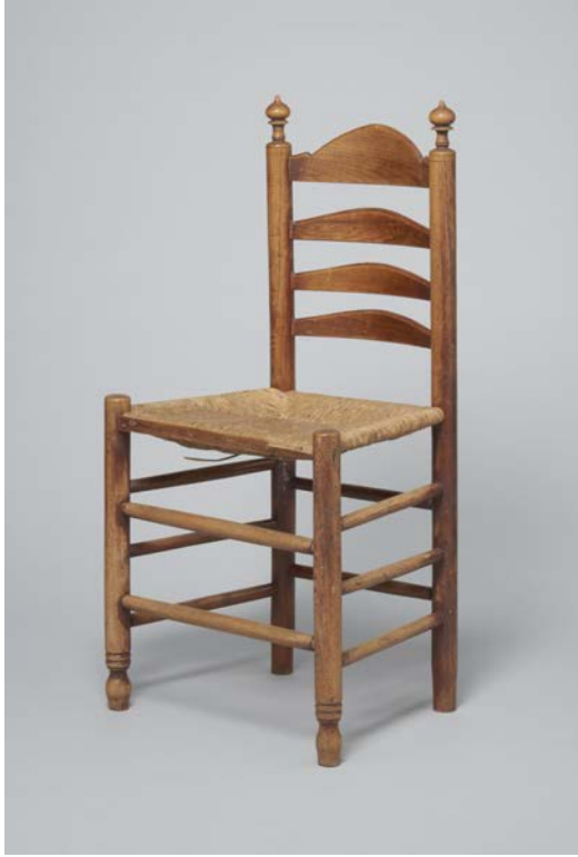
Figuur 5 Iepenhouten knopstoel met uivormige knoppen en een biezen zitting. Geheel machinaal vervaardigd en oorspronkelijk roodbruin afgewerkt. Datering 1910-1950. Collectie Nederlands Openluchtmuseum, inv.nr.: NOM.37184-67.