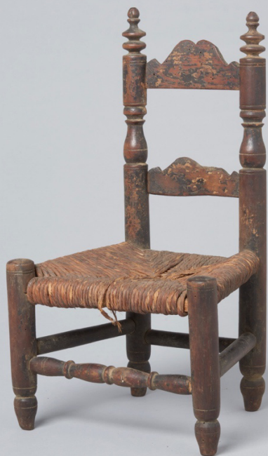
Figuur 1 Waarschijnlijk zeventiende-eeuwse, van oorsprong geheel zwartgelakte poppenknopstoel. Beukenhouten poten en essenhouten scheien. Collectie Nederlands Openluchtmuseum, inv.nr.: NOM.34398-62.

Het tweede type dat als wegbereider van de latere knopstoel gezien kan worden is een vaak klein vierpotig stoeltje met mattenzitting, waarvan de stijlen meestal gekloofd lijken te zijn. Duidelijk wordt dit type afgebeeld op het linker luik van het retabel getiteld 'Het mirakel van de gebroken zeef' uit 1552. 8 Een dergelijke gekloofde stoel, overigens van onbekende datum, is bewaard gebleven in de