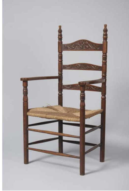
Figuur 6 Rijk gedecoreerde 'Oud-Hollandsche' eikenhouten knopstoel, gebaseerd op de zeventiende-eeuwse vorm, ca. 1910-1940. Collectie Nederlands Openluchtmuseum, inv.nr.: NOM.4931-44.