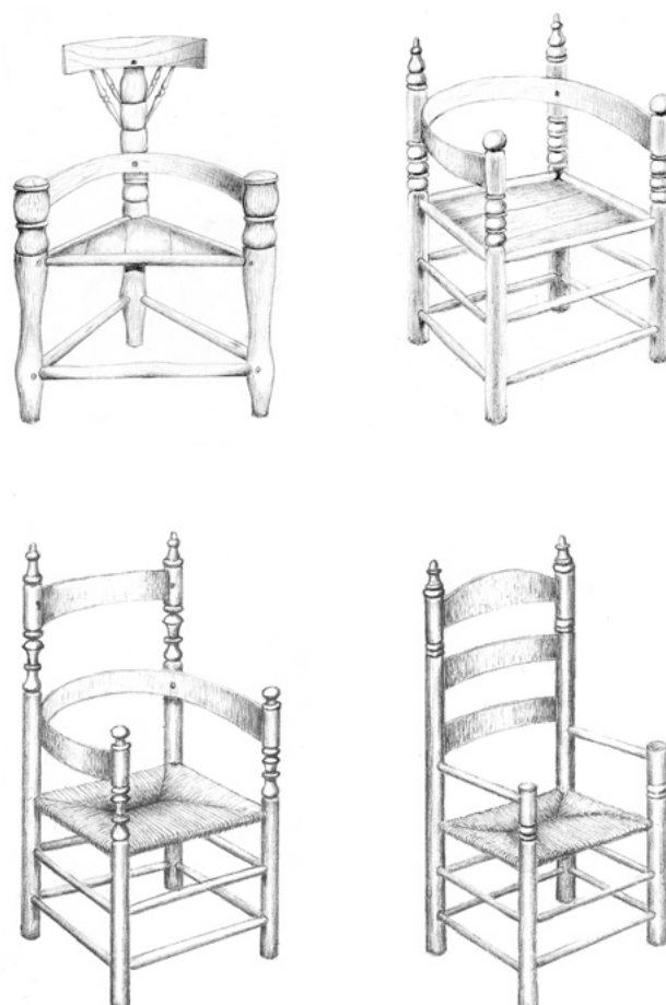
Figuur 3 Een driestlal met geschoorde kapregel en beugelvormige leuning (linksboven), een stoel met een beugelvormige leuning (rechtsboven), een stoel met verhoogde rug en beugelvormige leuning (linksonder) en een knopstoel met lage sporten als armleuningen (rechtsonder).